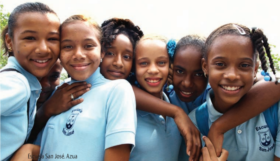
Escuela San José. Azua