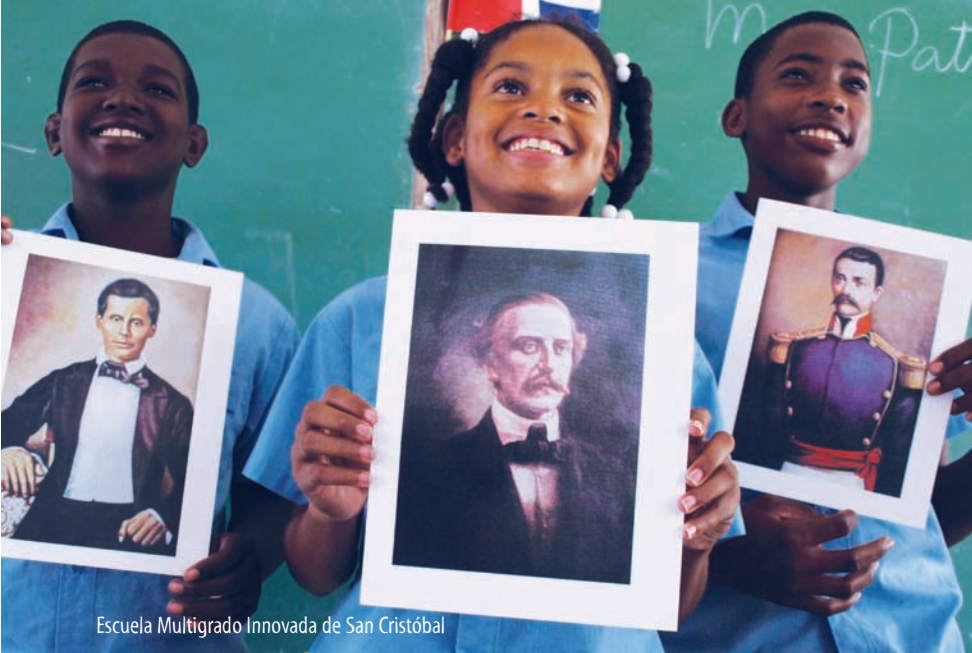
Escuela Multigrado Innovada de San Cristóbal